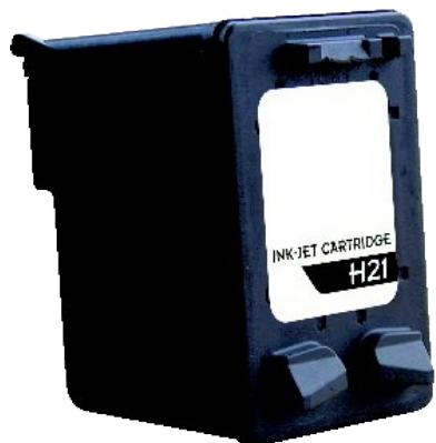
Cartouche HP21 recyclée